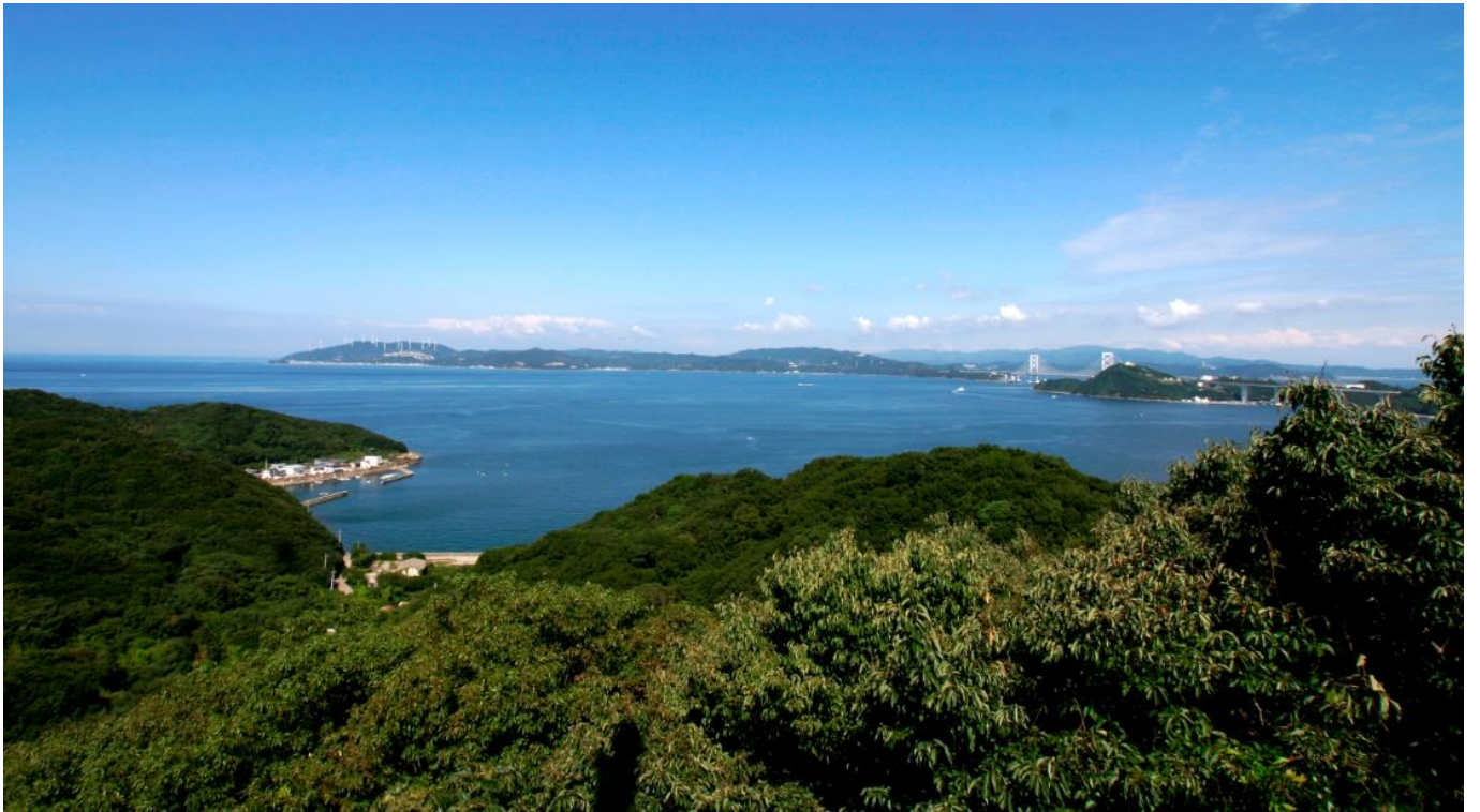
鳴門公園からウチノ海を望む